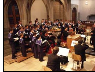
Les Zürcher Sängerknaben en concert

Cette qualité toujours recherchée pourrait laisser croire que les Petits Chanteurs sont réservés à une élite privilégiée. Les manécanteries sont ouvertes, au contraire, à tous les enfants qui aiment chanter et qui sont capables de persévérer dans l'effort. Certes, il existe des jeunes très doués, des voix exceptionnelles et il y a des chœurs qui proposent un travail plus difficile que d'autres. Mais il est rare qu'un enfant qui a le goût du chant ne puisse trouver sa place dans un groupe, dès lors qu'il met une réelle bonne volonté et qu'il fait preuve de persévérance.