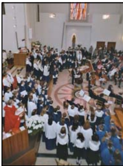
La messe finale lors du congrès national à Lugano en 2003

Les maîtrises aiment à faire partager leur enthousiasme pour le chant. Non seulement elles participent aux liturgies de leur lieu de résidence (paroisse, école, etc. ) mais elles donnent des concerts et organisent des tournées, quand elles en ont le niveau.