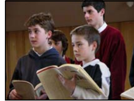
Une répétition de la Knabenkantorei Basel

Les Petits Chanteurs constituent un mouvement éducatif de la jeunesse, jusqu'à la fin des études secondaires, par le moyen du chant, de la vie en groupe, du côtoiement de multiples cultures et de la liturgie. La vocation première des Petits Chanteurs est précisément cette participation au culte: « Tous les enfants du monde chanteront la paix de Dieu » avait dit Mgr Maillot.